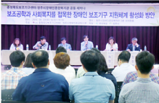
충북북도보조기구센터(가운데)와 청주시장애인종합복지관(오른쪽) 관계자들이 장애인보조기구 관련 사업 활성화 후추진방안 세미나를 개최하고 있다.

본회의는 장애인보조기구의 의미와 도입에 따른 사회적 비용, 보조기구와 서비스의 종류, 장애인보조기구 관련 사업의 현황, 장애인보조기구 관련 사업의 활성화 방안 등에 대해 강의를 진행했다. 이어 장애인보조기구의 종류와 장애인보조기구의 필요성에 대해 강의를 진행했다.