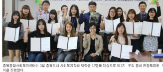
충북북부지역복지지원사업 3월 충북도내 사회복지시설 지원금 1200만 원을 전달하고 있다.

괴산군은 농어촌버스 운행이 어려운 지역에서 버스 기종으로 운행하는 택시를 개발하고 있다. 행복택시 '호우'는 택시를 개발하고 있다.