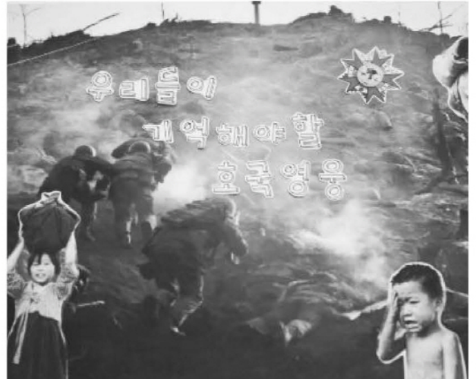
청주보훈지청이 제작 공개한 '우리들이 기억해야 할 호국영웅' 영상 포스터.