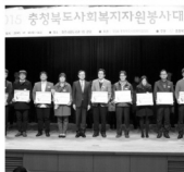
우수 자원봉사관리센터 현관 증정