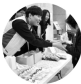
부드러운 목소리와 웃음과 인을 받아가세요~