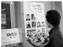
유엔네트워킹 멘토링 사업 홍보부스.