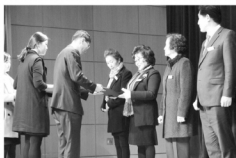
유공자 표창(충청북도지사 표창).