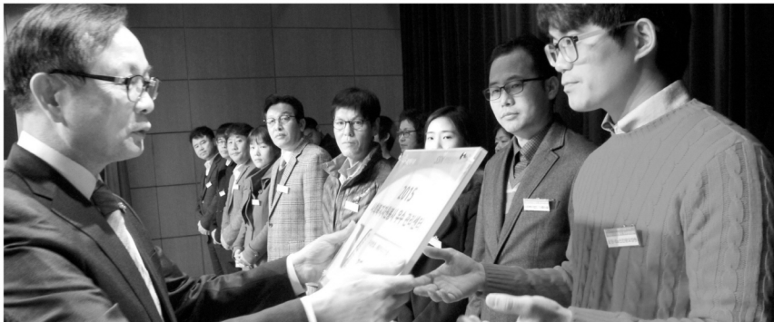
우수 자원봉사관리센터 현관 증정.