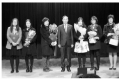
유공자 표창(충청북도의회 의장 표창).