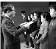
유공자 표창(충청북도 사회복지협의회장 표창).