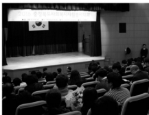
자리를 가득 채워주신 자원봉사자들.

자원봉사자의 날 기념식은 지난 2004년 국민의 자원봉사활동에 대한 참여를 촉진하고 자원봉사자의 사기를 높이기 위하여 매년 12월 16일을 자원봉사자의 날로, 자원봉사자의 날로부터 1주일을 자원봉사주간으로 설정하고, 규정하고 있다.