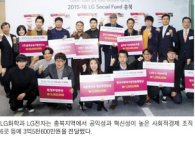
LG화학 LG전자는 후원금지원금과 공익성 특색이 있는 사회경제적 가치를 6대 분야 중 3500만원 상당의 장학금을 전달했다.