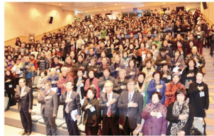
2016년 제1회 사회공헌활동 지원사업 참가자 1200명

충북도사회복지협의회(이하 협회)와 고용노동부는 2016년부터 3년씩 공모사업인 '사회공헌지원사업'을 통해 기업과 사회공헌활동에 힘쓰는 중소기업과 사회적기업 등을 지원할 예정이다. 지원 대상은 2016년 3월 31일까지 공모를 신청할 수 있는 중소기업과 사회적기업이다. 지원 대상은 2016년 3월 31일까지 공모를 신청할 수 있는 중소기업과 사회적기업이다.