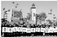
희망2016-농협캠페인의 102.9도를 달성하며 70개년째 대명사로 마무리되었다.

를 주축으로 50억9천476만 원에 달하는 사랑의 온도탑 102.9도를 달성하며 70개년째 대명사로 마무리되었다. 이번 캠페인에서는 50억 원에 사랑의 온도탑 102.9도를 달성하였다. 농협사회복지재단은 이번 캠페인에서 11시 40분경 102.9도를 달성하며 70개년째 대명사로 마무리되었다.