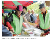
2015년 연합 가정의 달 무료급식봉사단

충청남도연맹봉사단 가정의 달 무료급식 기획 충북사회복지협의회 연합봉사단(나누리, 스마일 등)은 오는 5월 15일(일) 가정의 달을 맞이하여 활동 중점지역에서 무료급식 및 이웃봉사를 진행할 예정이다. 지역 내 이웃을 위한 따뜻한 사랑을 실천하기 위해 진행될 이번 기획사업은 약 1,000여명에게 쌀과 음료류, 나뭇잎으로 만든 아이, 떡, 무료 급식 등 다채로운 봉사활동이 진행될다.