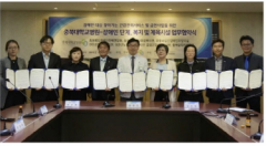
총북대학교병원 총북(평안)경안(관서)고급프로그램 참여 등

찾아가는 건강관리서비스 제공을 위한 프로그램 개발을 위해 연구팀을 구성한다.