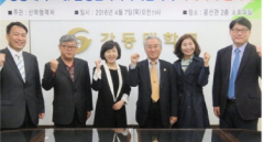
강동대학교는 강동군 소년관에서 윤성군 사회복지협의회(회장 박영호)와 강동구 사회복지협의회(회장 김기영)가 강동지역 학생 취업 지원에 협력하기로 합의했다.