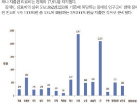
【그림2】 장애유형별 장애인 1인당 연평균 진료비(2011)

장애인 진료비의 상위 5%인 25,262,252원 기준에 해당하는 장애인 인구(약 천여 명) 장애인 진료비도 10,000원 중 40%에 해당하는 3,270,000원을 지출한 것으로 분석된다.