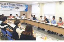
충북도 학교 밖 청소년지원센터 경량관 12명 2인팀까지. 학교 밖 청소년들의 바른 성장을 위한 다양한 프로그램을 지원한다.

충북도학교청소년지원센터 경량관 12명 2인팀까지. 학교 밖 청소년들의 바른 성장을 위한 다양한 프로그램을 지원한다.