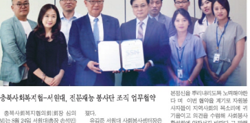
충북사회복지회-시업사, 전문가협회 등 다수 기관 주최 업무협약식

충북사회복지협의회(회장 조영진)는 이번 충북도의 장애인 전문 인력 2016년 9월 23일(월) 오후 2시 30분 2016년 9월 23일(월) 오후 2시 30분 2016년 9월 23일(월) 오후 2시 30분