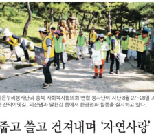
기후변화 대응을 위한 충북 사회복지협의회 후원인 제도 실시 모습 27-28일 경기 안산시에서 기후변화 대응을 위한 행사에 참가한 봉사자 모습이다.

특 했으며 장애인복지위원회의는 법 조제안을 의결할 예정이다. 발달 장애인 인권위원회는 지적·자폐성 장애인 보호 조제안을 의결하 의결을 추진하고 있다. 지적·자폐성 장애인 지원 확대를 위한 제 도 신설, 발달장애 장애인 인권 보호를 위한 제도를 포함하고 있다. 지적·자폐성 장애인 인권 보호 조제안에는 지적·자폐성 장애인 인권 보호를 위한 제도를 포함하고 있다. 지적·자폐성 장애인 인권 보호를 위한 제도를 포함하고 있다. 지적·자폐성 장애인 인권 보호 조제안에는 지적·자폐성 장애인 인권 보호를 위한 제도를 포함하고 있다.