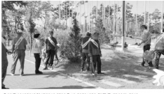
음성지역자활센터가 2014년 9월 10일(수) 오후 2시 청주장애인가족지원센터에서 2014년도 운영보고 및 고대회를 개최했다.

음성지역자활센터가 2014년 9월 10일(수) 오후 2시 청주장애인가족지원센터에서 2014년도 운영보고 및 고대회를 개최했다. 이날 행사에는 회원 100여 명이 참석했다.