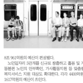
6.20 90억원의 예산이 편성됐다.

내년 예산이 전년 동기대비 3.3% 증가할 것으로 예상된다. 예산은 지난해 예산 대비 3.3% 증가한 57조3000억으로 확정됐다. 보건복지부 예산은 올해 예산 대비 4.8% 늘어난 57조3000억으로 확정됐다. 2017년에는 의료 취약지역에 대한 의료 인력 지원을 위한 의료인 지원금 2000억원이 신설된다. 2017년에는 의료 취약지역에 대한 의료 인력 지원을 위한 의료인 지원금 2000억원이 신설된다.