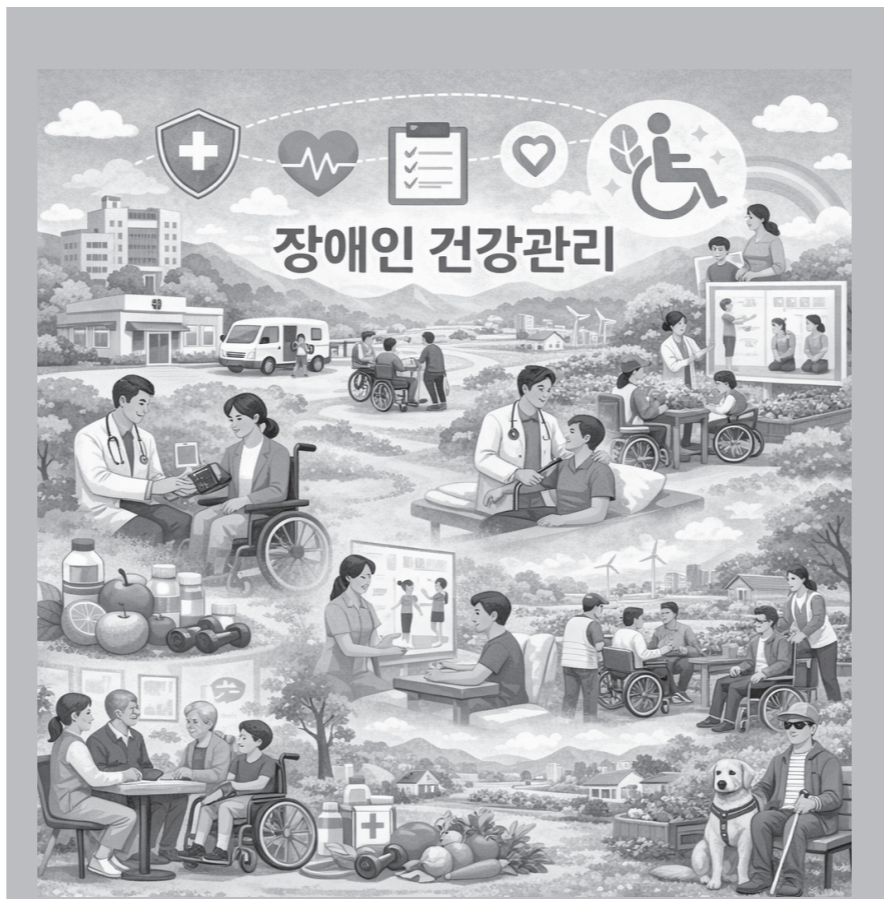
시를 활용해 생성한 이미지.

중증 장애학생의 교육활동 참여를 지원하기 위한 의료지원도 확대된다. 간호사 등 의료인이 학교를 방문해 상주 또는 순회 방식으로 일상적인 의료를 지원하는 사업을 현재 13개 시·도에서 올해안에 16개 시·도로 확대한다. 이를 통해 의료적 지원이 필요한 학생도 안정적으로 교육활동에 참여할 수 있도록 한다. 장애인의 건강증진과 사회참여 확대를 위해 생활체육 기반도 강화한다. 장애인 생활체육시설인 반다비 체육센터를 지속적으로 확충하고, 전국 17개 시·도에 설치된 장애인체력인증센터를 통해 체력측정과 맞춤형 운동지도를 제공한다. 또한 장애인 스포츠강좌 이용권 지원 등 다양한 프로그램을 확대해 생활체육 참여 기회를 넓힌다. 생활체육 참여가 어려운 장애인을 위한 재활운동 지원도 새롭게 추진한다. 재활치료와 생활체육 사이의 공백을 줄이기 위해 재활운동 시범사업을 운영하고, 의료기관이 아닌 지역사회 체육시설에서도 전문적인 건강관리 가능하도록 제도를 마련한다. 단기적으로는 국립재활원을 중심으로 시범사업을 실시하고, 관련 법령을 정비해 장기적으로 전국 확산을 추진할 계획이다.