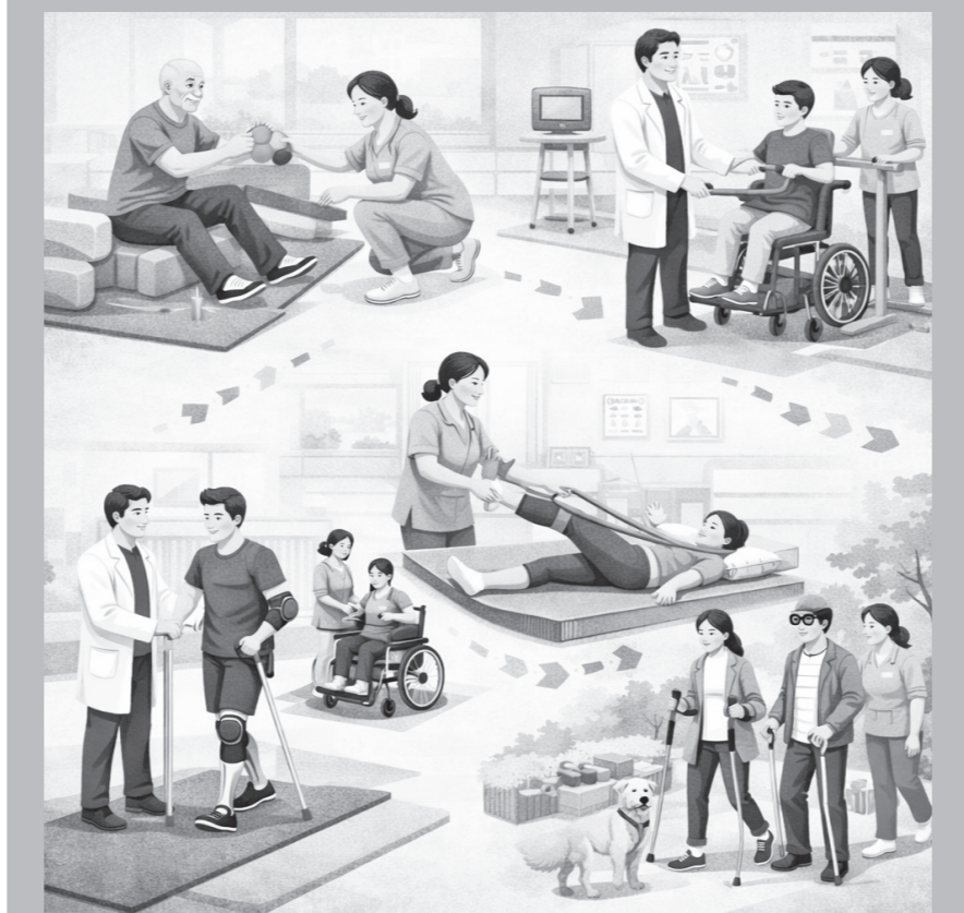
시를 활용해 생성한 이미지.