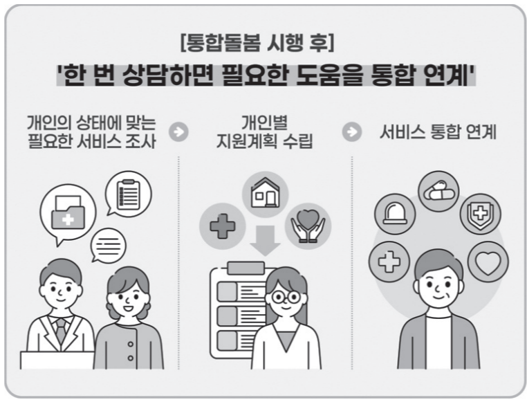
통합돌봄 신청·연계체계의 단계적 고도화.

역사회 통합돌봄은 국민이 살던 곳에서 건강하게 생활할 수 있도록 지원하는 핵심 제도"라며 "지속적인 보완과 개선을 통해 국민이 체감할 수 있는 통합돌봄 체