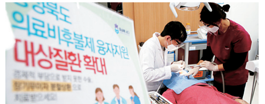
충북도민이 의료비 후불제 시행 병원에서 치료를 받고 있다.