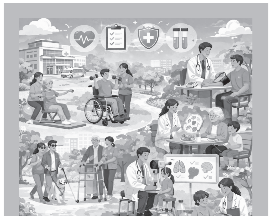
시를 활용해 생성한 이미지.