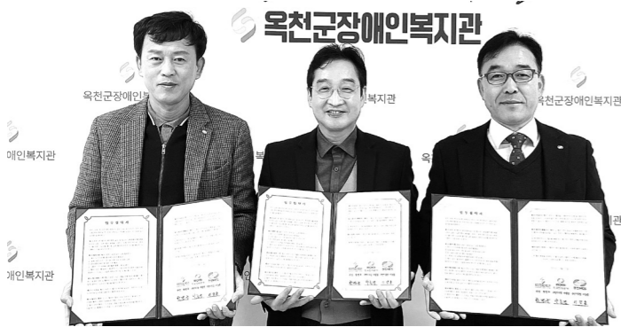
옥천군장애인복지관은 장애인복지 증진 협력 강화를 위해 양 기관과 업무협약을 체결했다.