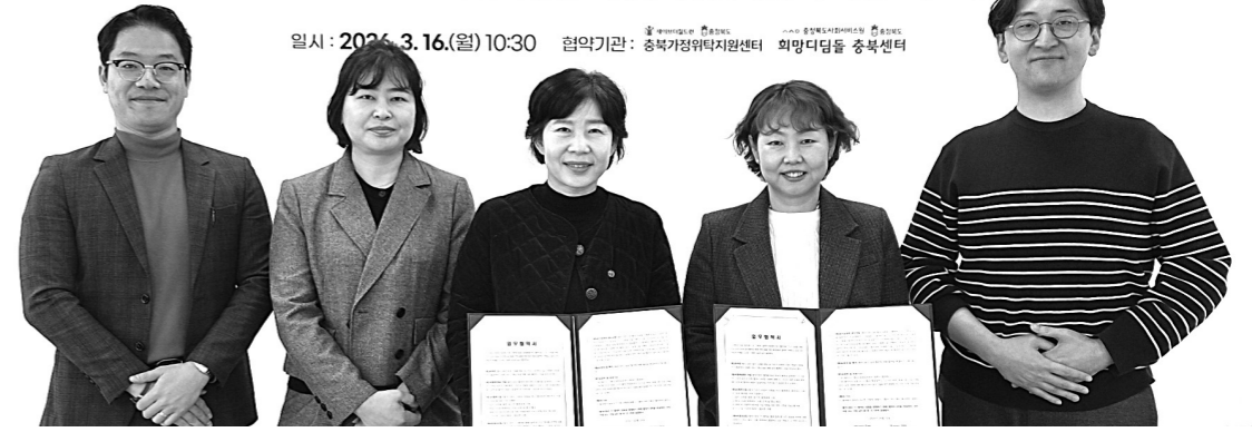
충북가정위탁지원센터와 희망디딤돌 충북센터는 자립준비청년 주거 정착 지원을 위한 업무 협약을 체결했다.

일시: 2026. 3. 16.(월) 10:30 | 협의기관: 충북가정위탁지원센터, 희망디딤돌 충북센터