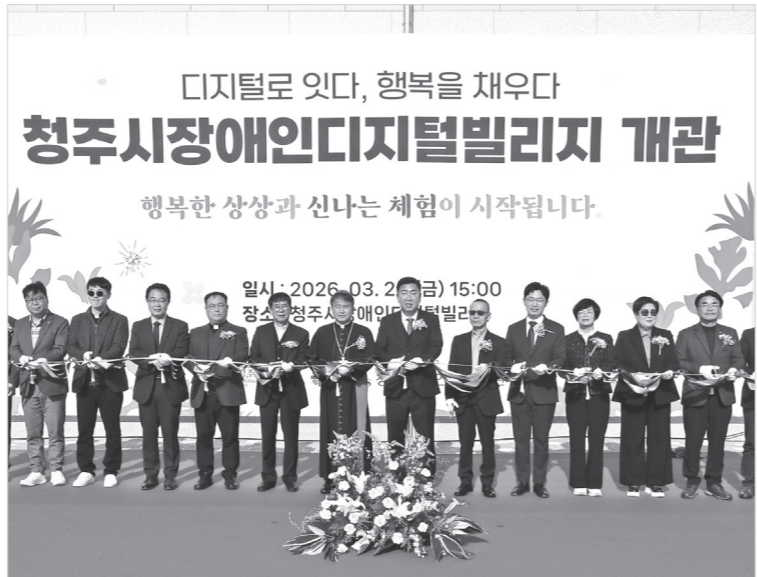
청주시는 장애인의 디지털 정보 격차 해소를 위해 흥덕구 신봉동 복지타운에 조성한 '장애인 디지털 빌리지' 개관식을 개최했다.

이범석 청주시장은 "장애인 디지털 빌리지가 디지털 소외계층인 장애인의 재활과 여가생활에 큰 도움이 될 것으로 기대한다"며 "앞으로도 장애인과 비장애인이 함께 행복하게 살아갈 수 있는 포용도시 청주를 만들기 위해 지속적으로 노력하겠다"고 말했다.