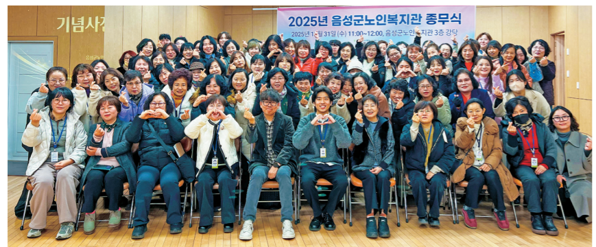
음성군노인복지관 직원 단체사진.

서동경 보건복지국장은 "요양병원 환자는 치료와 간병이 장기화되는 특성이 있는 만큼, 이번 전면 확대를 통해 의료비 부담으로 치료를 미루는 일이 없도록 촘촘한 의료안전망을 구축해 나가겠다"고 밝혔다.