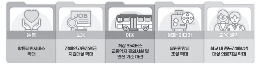
2026년 달라지는 장애인 정책.

장애인의 지속적인 건강관리를 위해 장애인 건강주치의 제도를 활성화한다. 방문재활 서비스를 도입하는 등 제공 서비스를 다양화하고, 시범사업 운영 결과를 바탕으로 제도를 개선해 본사업 전환을 추진한다. 또한 다학제 협진 체계 도입 등 다양한 서비스 제공방안을 검토해 장애 특성에 맞는 통합적인 건강관리 가능하도록 한다. 장애인이 일상생활 속에서 자신의 건강상태를 인지하고 관리할 수 있도록 건강교육도 확대한다. 장애유형별, 생애주기별, 질환별 특성을 고려해 대면과 비대면 교육을 병행하고, 장애인이 쉽게 이해할 수 있는 방식으로 건강관리 정보를 제공할 계획이다. 장애인 건강검진 체계도 강화한다. 당면지정기관을 포함한 장애인 건강검진기관이 원활히 운영될 수 있도록 지원하고, 시설 및 장비 기준을 개선해 2030년까지 112개소 이상으로 확충한다. 또한 지역별 설치 여건을 고려해 당면지정기관 외에도 장애인 건강검진기관을 지속 확대 설치한다. 검진 결과 이상 소견이 있는 경우에는 지역장애인보건의료센터와 연계해 사후 관리가 이루어지도록 관리체계를 강화한다. 장애유형과 성별 특성을 고려한 맞춤형 건강지원도 확대한다. 취약 장애를 신