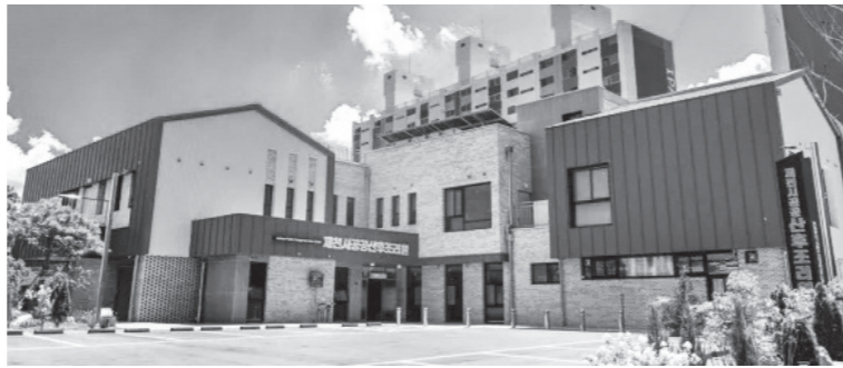
제천시 공공산후조리원 전경.

제천시 공공산후조리원을 향한 전국 지자체의 관심은 건립 초기부터 이어져 왔다. 개원 전에는 경기도 평택시와 경북 예천군 등이 방문해 사업 추진 과정과 설계 방향을 벤치마킹했으며, 개원식 당시에도 충북 충주시, 경기도 시흥