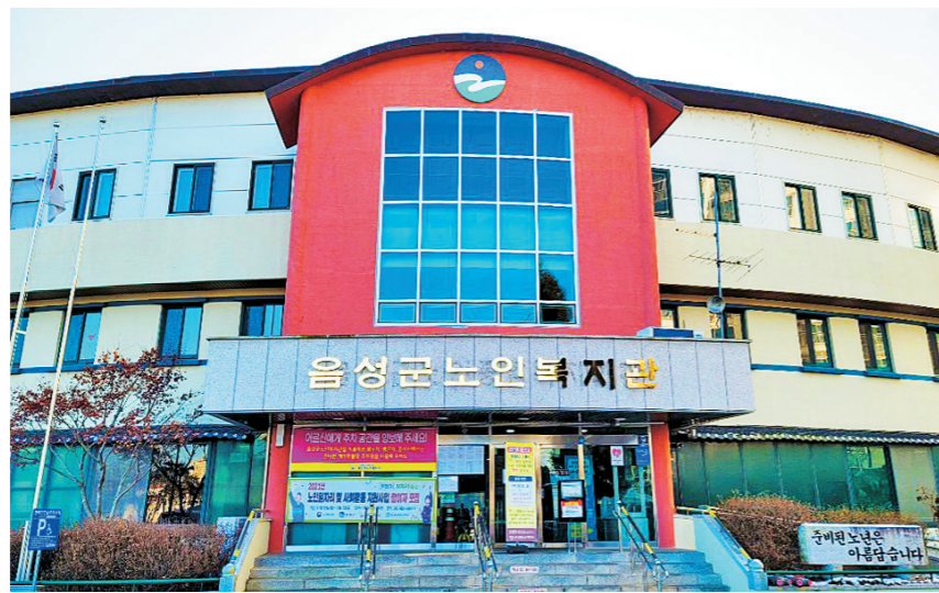
금양읍에 위치한 음성군노인복지관 전경.