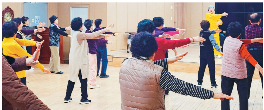
복지관을 이용하는 어르신들이 프로그램에 참여하고 있다.