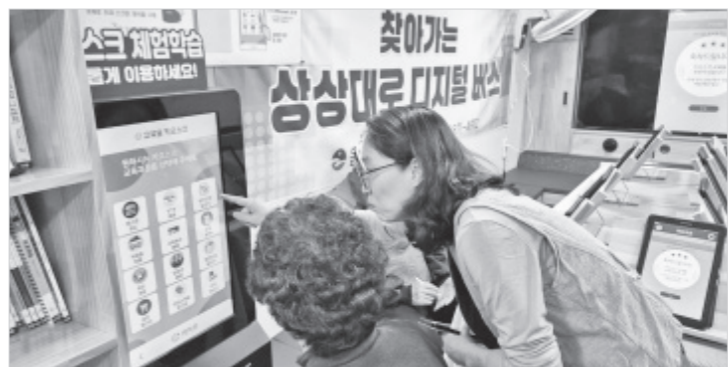
음성군은 주민들을 대상으로 '찾아가는 상상대로 디지털버스'를 운영하고 있다.

음성군은 12일 지역 주민의 디지털 역량 강화를 위해 지난해에 이어 올해도 '찾아가는 상상대로 디지털버스'를 운영한다고 밝혔다.