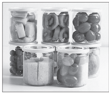
돌봄교실 과일간식 예시.

유지하며, 친환경 또는 GAP 인증 농산물을 우선 활용해 안전성과 품질을 강화한다.