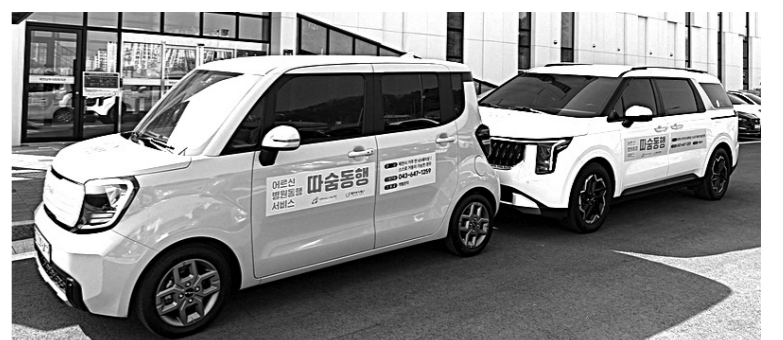
제천형 따숨동행 서비스에 이용되는 차량.

제천복지재단은 이 서비스 외에도 돌봄 식사 지원사업인 '다함께 찬찬찬', 맞춤형 노인 주거 지원 등 어르신들이 익숙한 환경에서 건강하고 안전하게 생활할 수 있도록 다양한 맞춤형 복지 사업