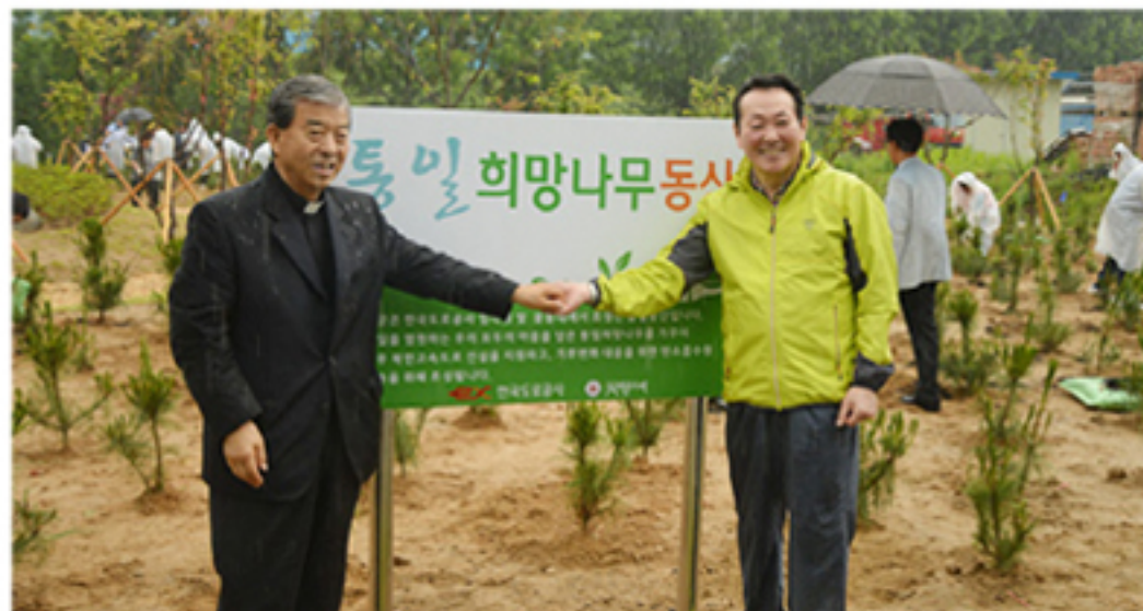
음성꽃동네와 한국도로공사가 꽃동네에 소나무 1천주 식재하고 통일희망나무 동산을 만들기 위해 3년 동안 1천5백만 그루를 심는 프로젝트를 약속한 뒤 기념사진을 찍고 있다.

도공 관계자는 꽃동네 사회복지시설 관계자들과 함께 통일을 염원하는 통일희망나무 동산을 만들게 되어 매우 뜻 깊게 생각한다며 이날 조성된 통일희망나무 동산은 남