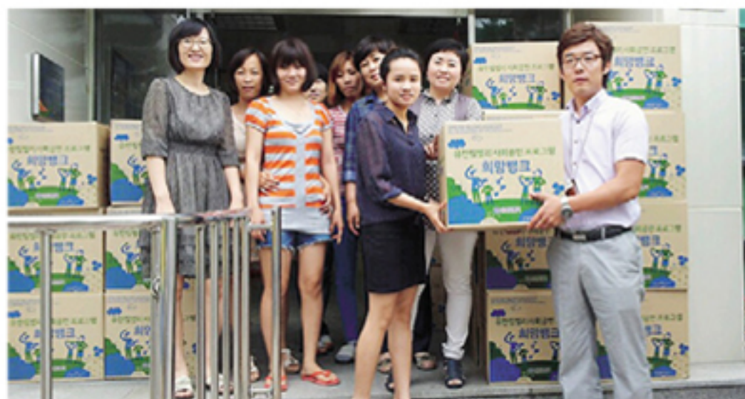
제천시사회복지협의회가 유한킴벌리로부터 지원받은 기저귀 50상자를 다문화가정 중 출산을 앞두고 있거나 신생아가 있는 40가정을 선정해 전달했다.