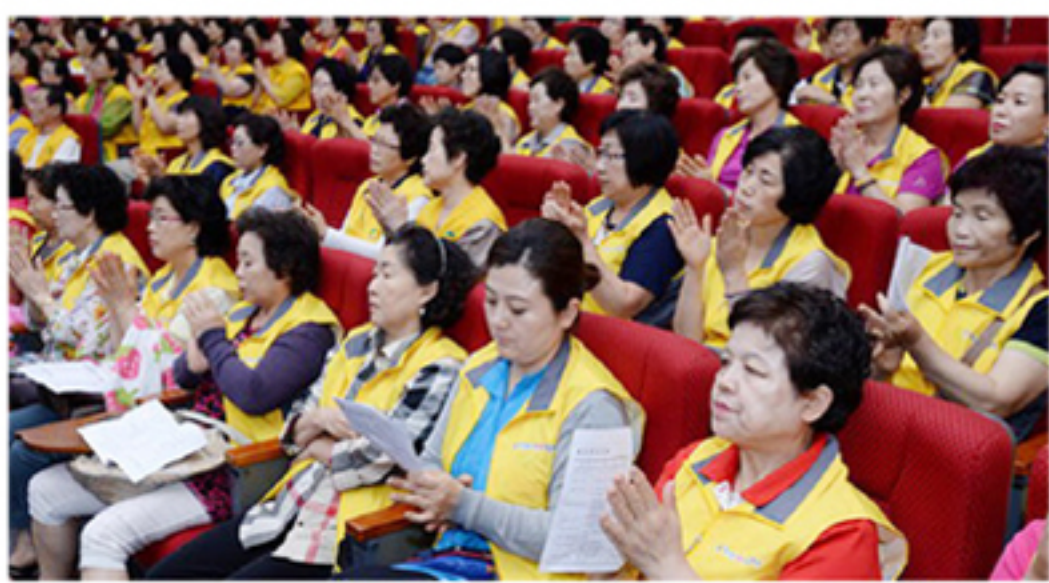
청주시 청원군 자원봉사자들은 화합 한마당에서 봉사에 앞장설 것과 통합청주시 출범을 위해 화합할 것을 다짐했다.

행사는 기념행사 후 1부 행사에서 자원봉사자들을 위한 축하공연과 행운권 추첨이, 2부 행사에서 어울림 화합 한마당으로 미니게임과 단별 미션게임, 행운나눔기 등이 펼쳐져 참가자들의 흥미를 높였다. 또 행사를 마친 후 참가자들은 행사장과 인근지역에 청결활동을 펼쳐 자원봉사 의미를 더하기도 했다.