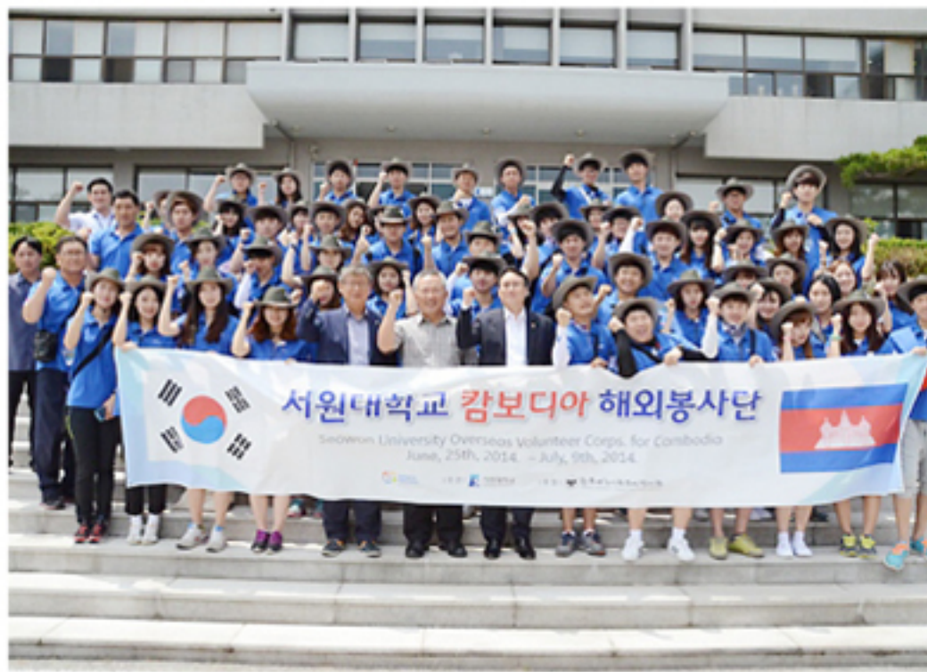
6월 24일 서원대 해외봉사단 60명이 발대식을 갖고 있다.

서원대학교 해외봉사단 60명이 6월 24일 발대식을 갖고 베트남과 캄보디아 현지로 출발했다. 이들은 7월 9일까지 베트남 호치민시와 캄보디아 프놈펜 등에서 빈민 지역의 학교를 방문해 한국어와 영어, 종이공예, 태권도, 사물놀이 등의 교육봉사를 진행하며, 사랑의 집짓기 마을 공동우물 및 화장실, 학교 시설보수 등의