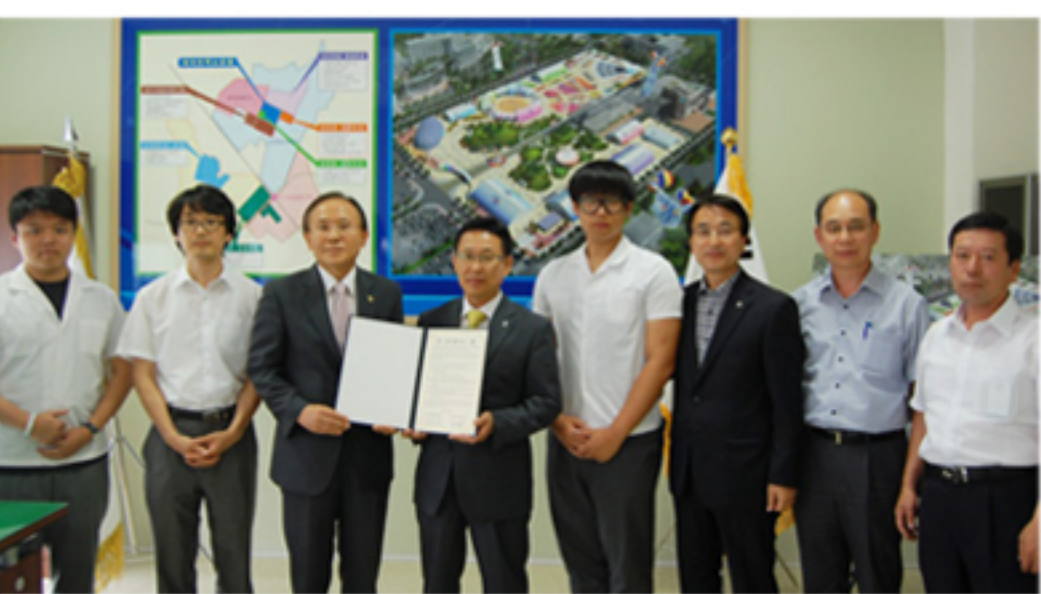
청주외고와 오송바이오엑스포조직위원회가 업무협약을 갖고 기념촬영을 하고 있다.