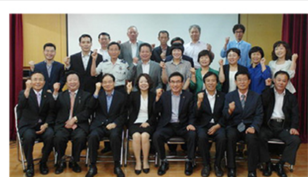
청주시 북대2동이 6월 18일 주민센터에서 사랑 나눔을 위한 행복올타리 운영위원회 발대식을 가졌다.

이번 연차대회 종합최우수를 휩쓴 대상은 청주한라이온스클럽이 차지하는 영광을 얻었다. 연차대회 기념 봉사사업으로는