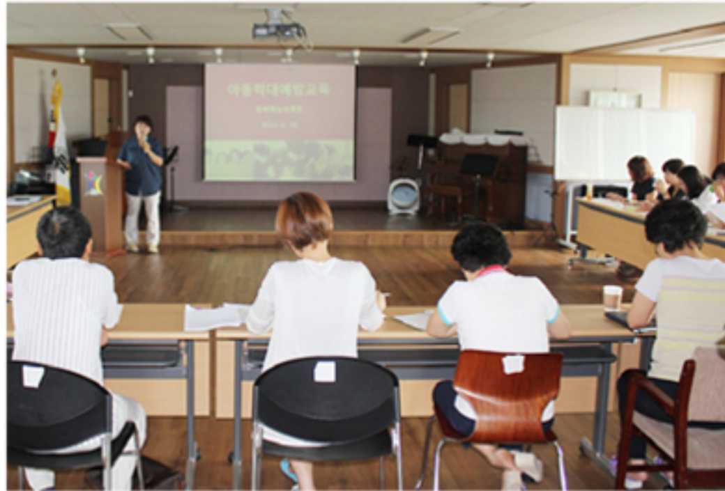
충북아동복지협회가 협회 회원기관 종사자들을 대상으로 아동학대예방교육을 실시 하고 있다.

한편 이 사업은 충북종합사회복지센터와 업무협약을 맺어 아동복지시설 종사자 역량강화 교육을 위해 아동복지관련 전문교육을 지원하고 있다.