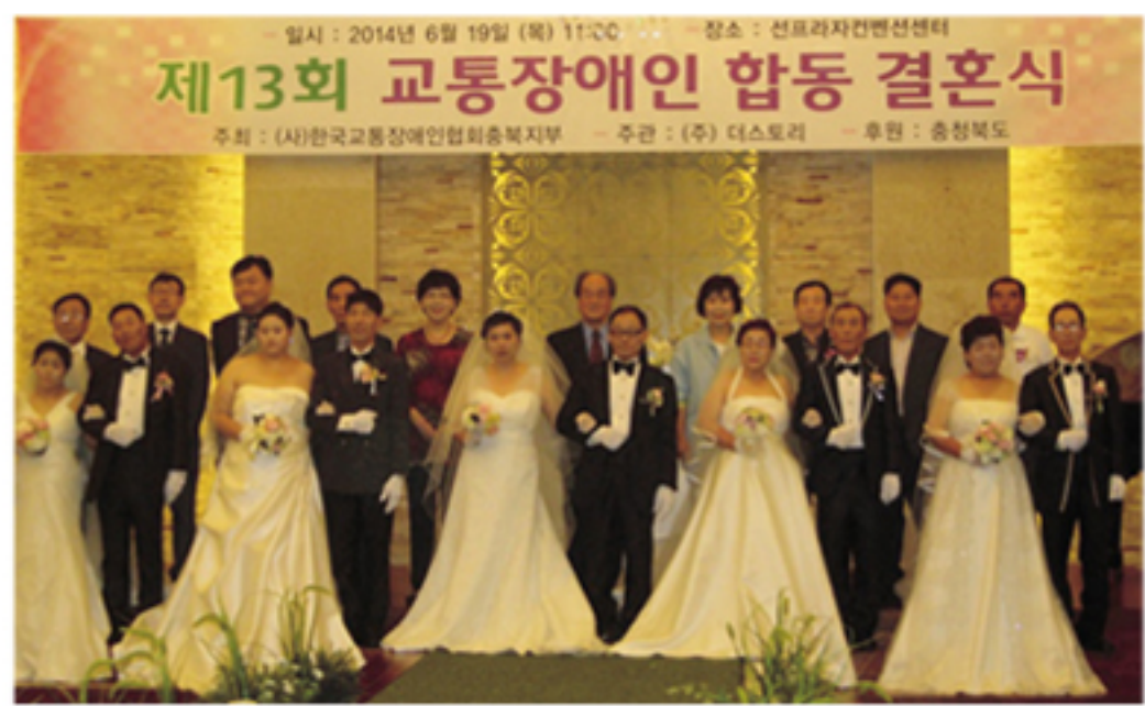
도내 장애인 부부 5쌍이 화촉을 올린 후 기념촬영을 하고 있다.