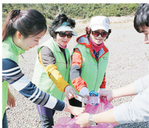
연합봉사단원들이 군산 대각산에서 자연정화활동을 펼치고 있다.