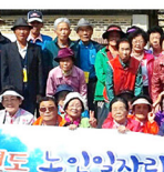
2014년 9월 3일(수)

충북장애인미술협회 21회 성향 충북장애인미술협회 21회 성향전은 충북장애인미술협회가 주최하고, 장애인들의 예술적 재능을 보여주는 전시회이다. 특히 이번 4월엔 충북장애인미술협회 21회 성향전을 개최했다.