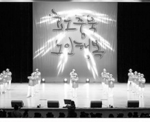
대한노인회 충북지역협의회를 주관하는 10월 10일 청주 대우체육관에서 열린 제13회 노인일기 기념식 모습이다.

견학대회를 참가한 한 어르신은 “경로당이 외부 부유층이 아닌 30대 전후의 다양한 직종 어르신들이 많이 참석해 좋았다.”