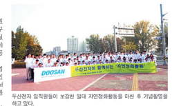
두산전자 충북지역에 보존한 일대 자연경관회복을 위한 추기 기념행사를 하고 있다. 두산전자는 10월 29일 일찍이 100여 명을 동원하여 사내를 크게 꾸민 것으로 알려져 있다. 두산전자는 10월 29일 일찍이 100여 명을 동원하여 사내를 크게 꾸민 것으로 알려져 있다.

두산전자는 10월 29일 일찍이 100여 명을 동원하여 사내를 크게 꾸민 것으로 알려져 있다. 두산전자는 10월 29일 일찍이 100여 명을 동원하여 사내를 크게 꾸민 것으로 알려져 있다. 두산전자는 10월 29일 일찍이 100여 명을 동원하여 사내를 크게 꾸민 것으로 알려져 있다.