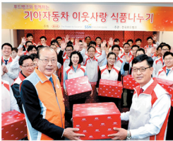
기아자동차는 10월 29일(월) 중산권 기아차 사회봉사팀을 비롯해 기아차 사원 50여명과 한사보(한국사회복지협의회)의 자원봉사단이 함께 나눔 박스를 지원했다. 나눔 박스는 이웃사랑 나눔박스를 지원했다. 나눔 박스는 이웃사랑 나눔박스를 지원했다.

이런 것 외에도 나눔박스는 사회적 필요를 채우고 자선, 기부, 봉사를 통해 나눔을 실천하는 사회적 분위기를 조성하는 데도 큰 역할을 할 것으로 기대된다. 나눔 박스는 이웃사랑 나눔박스를 지원했다. 나눔 박스는 이웃사랑 나눔박스를 지원했다. 나눔 박스는 이웃사랑 나눔박스를 지원했다.