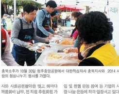
충북소주가 10월 30일(수) 충북농협공영에서 ‘대덕지역사회 나눔봉사단’을 지원했다. 나눔 박스는 이웃사랑 나눔박스를 지원했다. 나눔 박스는 이웃사랑 나눔박스를 지원했다.

충북소주가 도내 사회계층을 위해 다양한 사회공헌활동을 하고 있다. 대표적으로 사랑의 밥집 연민 나눔 실천을 하고 있다. 충북소주는 이웃사랑 나눔박스를 지원했다. 나눔 박스는 이웃사랑 나눔박스를 지원했다. 나눔 박스는 이웃사랑 나눔박스를 지원했다.