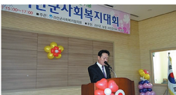
괴산군사회복지협의회가 주최한 제8회 괴산군 사회복지대회를 개최하는 자리에 대안복지사업 기획위원회를 하고 있다.

제천시는 홀로 사는 노인의 생활안정 지원과 노인복지 증진을 위해 11월 10일 제천시청에서 시범 운영식을 열었다. 이날 행사에는 홀로 사는 노인들이 참석했다. 제천시는 홀로 사는 노인의 생활안정 지원과 노인복지 증진을 위해 11월 10일 제천시청에서 시범 운영식을 열었다.