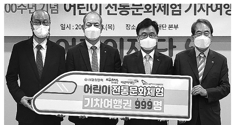
초록우산 어린이재단 등 4개 기관 관계자들이 어린이날 100주년을 맞아 '전통문화체험 기차 여행' 업무협약을 체결하고 기념사진을 찍고 있다.

어린이날 100주년을 맞아 취약계층 어린이를 태운 전통문화 체험 기차가 출발한다. 한국철도공사(코레일)가 지난 달 28일 신흥중앙회, 한국전통문화재단, 초록우산 어린이재단과 함께 기차여행을 위한 업무협약을 체결했다. 협약식에는 나희승 코레일 사장을 비롯해 우옥현 신흥중앙회