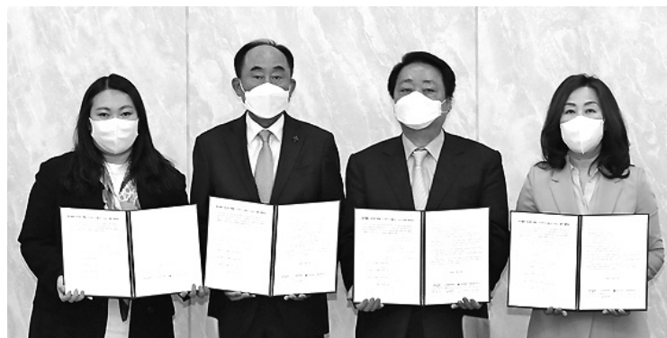
청주시가 지난달 27일 지역화폐인 청주페이 내 기부 서비스 '기부美' 운영을 위해 청주복지재단, 충북사회복지공동모금회, 코나아이와 업무 협약을 체결했다.