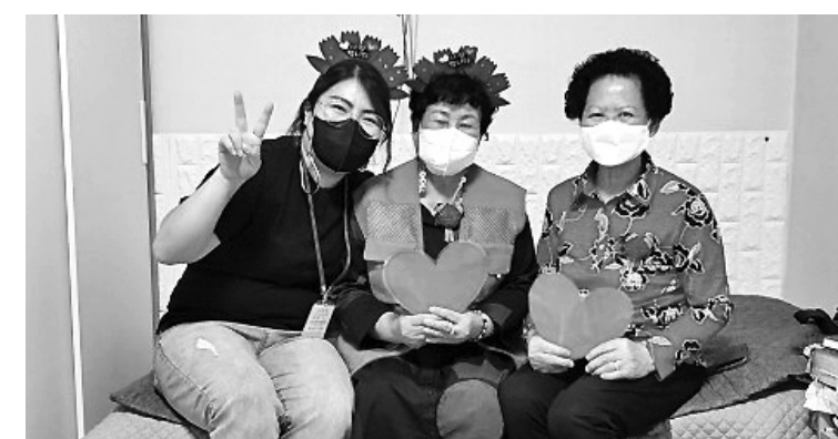
청주흥덕시니어클럽은 어버이날을 맞아 지역 어르신 60여분에게 '마음으로 전해주는 봄' 행사를 진행했다.

직원들이 직접 어르신 댁에 방문하여 공경하는 마음을 담아 카네이션을 달아드리고 떡과 선물을 전달했다.