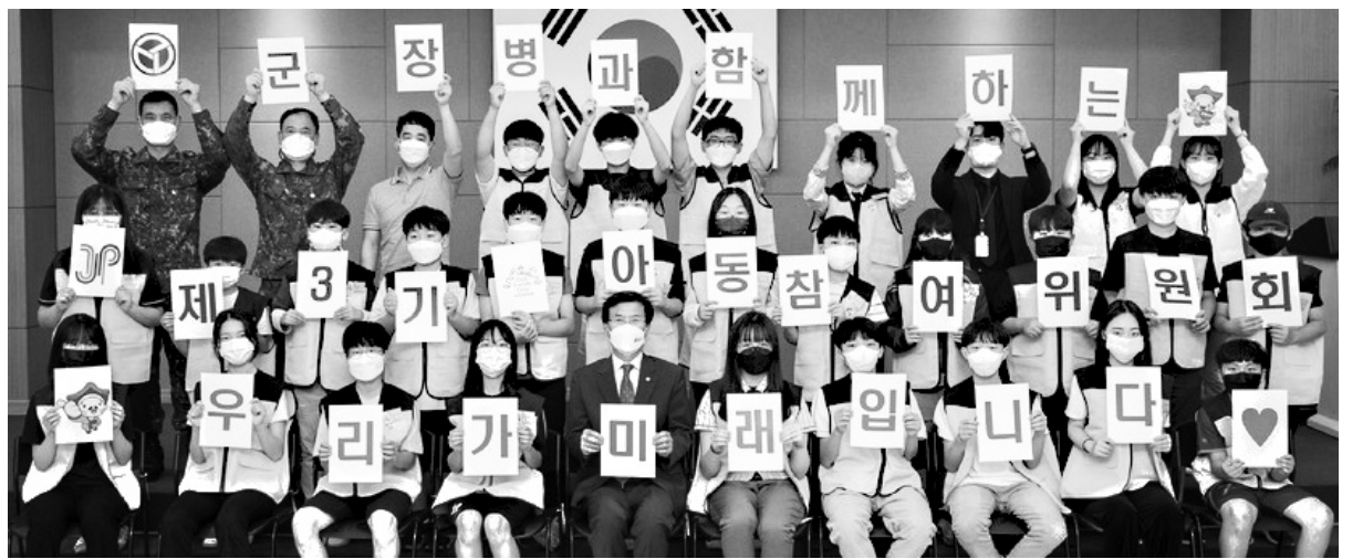
증평군이 20일 제3기 증평군 아동참여위원회 위촉식을 개최하고 기념촬영을 하고 있다.

선을 다하겠다"고 말했다. 한편 '괴산읍 도시재생 뉴딜사업'은 180억 원의 예산을 투입해 2023년까지 추진하는 사업으로 괴산허브센터, 와유(臥遊)재, 영유아놀이돌봄센터, 괴산 영상제작소, 보행중심거리 조성 등 쇠퇴한 구도심 지역을 정비할 계획이다.