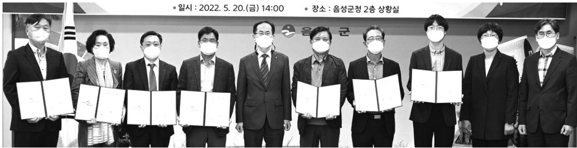
음성군은 여성친화기업으로 선정된 7개 업체와 협약식을 개최했다.

아동권리북은 올해 7세 아동을 대상으로 배부된다. 어린이집, 아동생활 시설, 사례관리 선생님과 함께 권리교육 시 활용될 예정이다. 아동권리북을 원하는 기관에는 그림 파일이 제공된다. 시는 배포된 아동권리북을 일부 수거해 아이들이 표현한 글과 그림을 전시한다는 계획이다. 아이들 의견 가운데 좋은 제안은 정책에 반영하기로 했다. 시는 홈페이지를 통해서도 아이들의 의견을 연중 수렴할 예정이다. 시가 이번엔 7세 아동에게 책자를 배부한 것은 6세 이하의 글과 그림으로 자신의 의견을 표현하는 게 아직은 어렵다고 판단해서다. 청주시는 지난해 12월 유니세프 아동친화도시로 인증됐다.