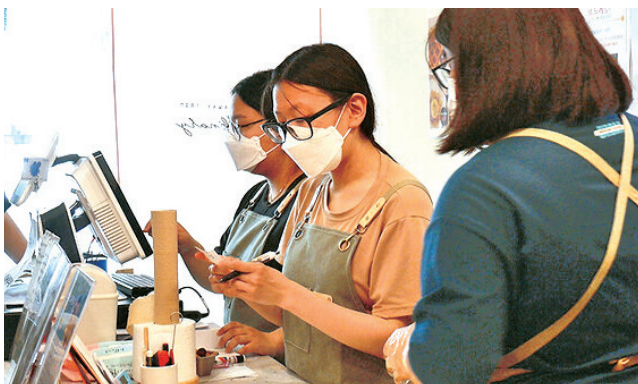
'청소년 자립카페'에서 청소년들이 직접 카페 운영을 하고 있는 모습.

단순한 봉사활동이나 기부가 아닌 지역현안을 발굴해 지역의 문화적 기류를 변화시키는 것에 초점을 두고 있