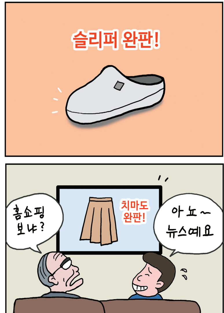
항색 저널리즘 : 자극적, 편향적, 선정적 보도를 일삼는 언론