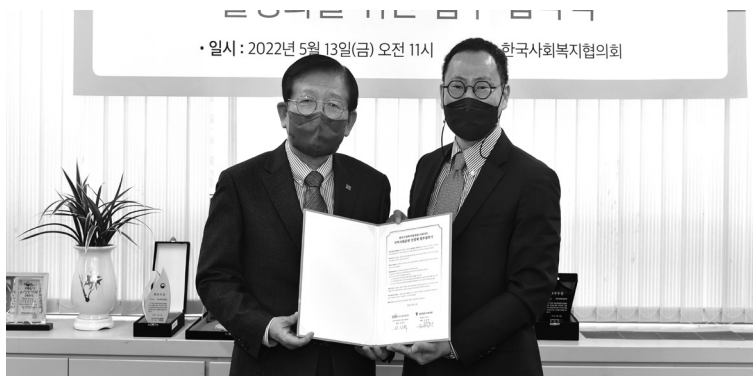
지난 13일 한국사회복지협의회와 법무법인 디라이트는 업무 협약식 개최 후 기념 사진을 찍고 있다.

통해 사회공헌 활동을 인정 받았다. 법무법인 디라이트는 스타트업 및 4차 산업혁명과 관련한 불특체인, 인공지능, 빅데이터, 콘텐츠 및 미디어, 바이오 · 헬스케어 등의 분야에 전문성을 갖춘 로펌이다. 통상적인 법률구조 활동에 더해, 장애인을 위한 기술공모전, 사회단체 법률지원사업 등 다양한 공익 프로그램을 운영하고 있다. 디라이트는 이번 협약을 통해 인정기업 · 인정기관을 대상으로 ESG와 사회가치 활동 및 사업 전반에 대해 법률자문을 제공한다. 또한 지역사회공헌 인정제도의 조기 정착과 확산을 위해