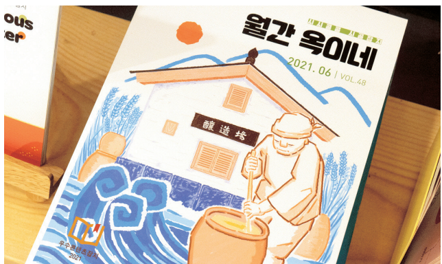
고래실에서 발간하는 '월간 옥이네'.

고래실이 소재한 옥천군은 대전광역시와 인접해 있는 농촌지역으로 7~80년대까지만 해도 큰 기업과 공공기관이 자리하고 있는 매우 활기가 넘치던 지역이었다. 하지만, 최근 과거의 영광은 사라지고 대전에 문화적으로 종속되어 옥천만의 지역문화 활성화를 위해 지역주민들의 이야기에 귀를 기울이는 것을 최우선으로 생각하여 2017년 7월 옥천의 사람, 문화, 역사 등 다양한 이야기를 담은 문화잡지인 '월간 옥이네'를 창간하게 됐다.