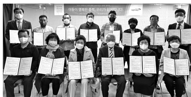
초록우산 어린이재단 충북본부와 15개 공모사업 수행기관이 '2022 초록우산 어린이재단 공모사업 in 충북'을 위한 업무협약을 체결하고 있다.