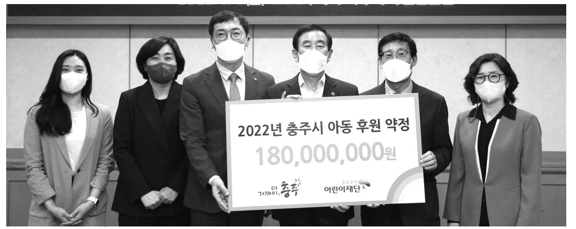
충주시와 초록우산어린이재단 충북지역본부가 3일 충주시청에서 아동 후원 약정을 체결하고 있다.

스센터, 음성여성취업지원센터와 연계해 여성 전문인력 양성 및 구인 구직 지원, 일·생활 균형 실천, 여성친화 일터 만들기 등 근로자와 상생 발전해 가도록 노력하기로 했다. 군은 협약 기업에 여성친화기업 현판 수여와 양성평등 교육, 기업 지원 사업 때 가점부여, 기업홍보 등 다양한 인센티브를 지원할 예정이다. 올해는 7개기업에 환경개선 사업비를 각각 700만 원까지 확대·지원할 방침이다.