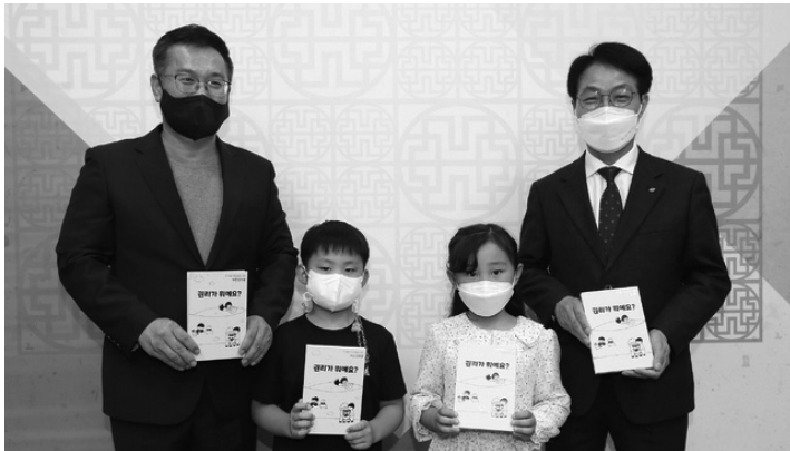
청주시가 6일 전국 최초로 제작한 아동권리북을 아동대표 등에게 전달하고 있다.