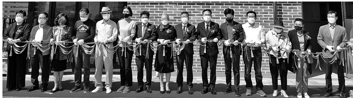
청주시장애인가족지원센터 재건축 준공식이 3일 열린 가운데 참석자들이 테이프커팅을 하고 있다.

청주사회복지실천연대는 지난해 7월 창립해 50여명의 회원들이 함께 활동하고 있는 청주시 사회복지 종사자의 권익과 인권을 위해 활동하고 있는 단체이다. 주요활동으로는 ‘인권콘서트’, 사회복지 종사자의 인권과 권익을 위해 청주시에 지원요청을 위한 ‘성명서 발표’ 등을 추진한 바있다.