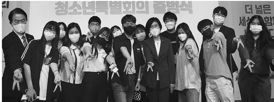
이기순 여성가족부 차관이 20일 '2022년 청소년특별회의 출범식'에서 청소년들과 기념사진을 찍고 있다.