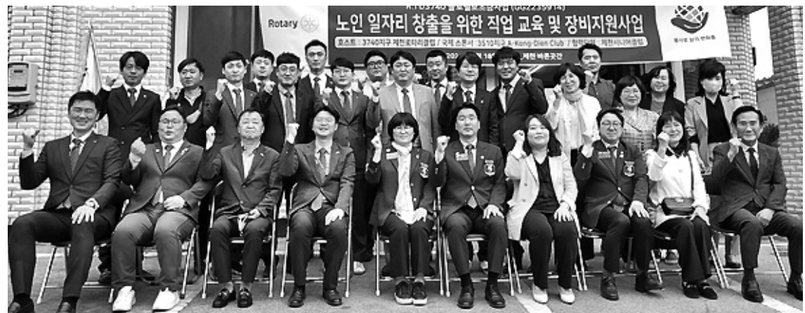
제천시니어클럽의 시장형 사업단 '바른 공간' 개소식 참석자들이 행사 후 단체로 기념촬영을 하며 파이팅하고 있다.

제천시니어클럽, 노인일자리 시장형 사업단 본격 운영 건강한 먹거리 제공... 참기름·고춧가루 등 생산 판매