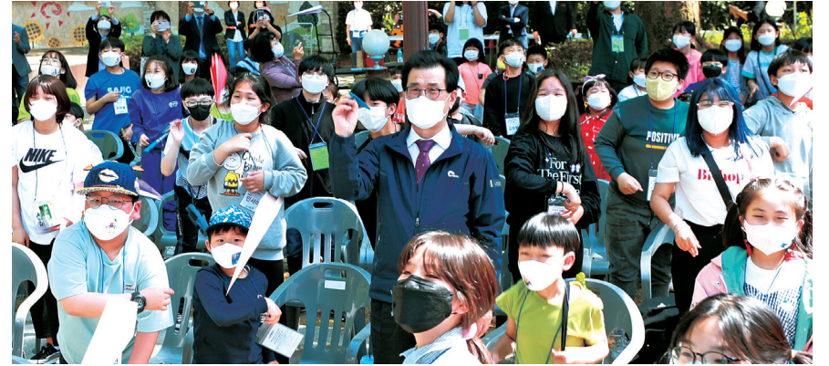
이시종 충북도지사가 어린이날 행사에 참여한 아이들과 함께 '희망의 종이비행기'를 날리고 있다.

최근 옥천은 청년인구 유출 문제로 5만 인구가 무너지고 있다. 이중 대부분의 청년들이 대도시로 나가려고 하는 것이 현실이다. 이를 위해 청년공간 조성, 일자리 창출, 청년문화 프로젝트 등 청년인구의 유입과 지역의 활력을 높일 수 있는 다양하고 창의적인 사업들을 추진할 예정이다. 지역의 청년들이 '월간 옥이네' 등 옥천의 매체에 더욱 관심을 갖고 외부로 전파시켜 지속가능한 지역사회 조성을 위해 선도하는 주역이 되길 바라본다.